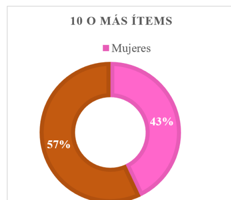
Figura 2. Grupo tres por género

Los resultados por géneros obtenidos en esta investigación dicen que el grupo con mayor nivel de depresión está conformado por hombres (Figura 2, grupo tres por género).